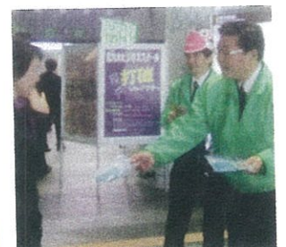
JR小倉駅で街頭啓発