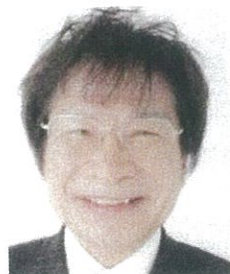
教育評論家尾木直樹さんを イメージキャラクターに起用